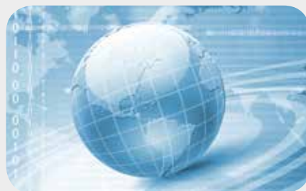
Realisieren sonstiger Funktionen