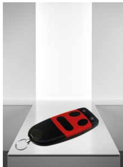
Alles begann mit einem innovativen, robusten Handsender.

Um noch effizienter zu arbeiten bieten wir unseren Kunden und Vertriebspartnern die Möglichkeit, einzelne EMERCOS-Komponenten zu beziehen. Wählen Sie aus unseren Produkten und realisieren Sie Ihre spezifischen Lösungen: Einfach, schnell und zuverlässig. Gerne unterstützen wir Sie bei der Auswahl und Kombination der verschiedenen Komponenten.