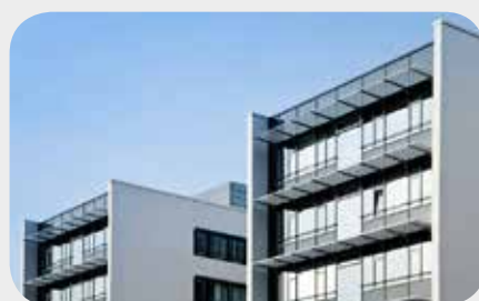
Alarmanlagen scharf- & unscharf schalten