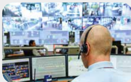
Ansteuern von Geräten & Anlagen