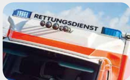
Absetzen von Not- und Hilferufen