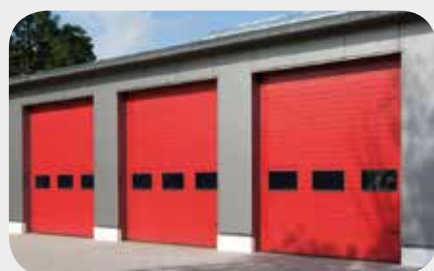
Öffnen von Türen & Toren