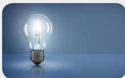
Ein- & Ausschalten von Beleuchtung