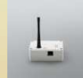
WaveNet Router 3065 mit Schutzfunktion