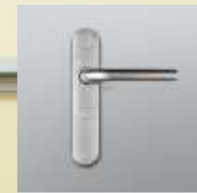
Türbeschlag: Digitales SmartHandle 3062

Mit dem WaveNet Router 3065 – Schutzfunktion und geeigneten digitalen Türbeschlägen bietet SimonsVoss ein funkgesteuertes digitales Schließsystem, das speziell in Schulen für ein Höchstmaß an Sicherheit sorgt. Blitzschnell in der Anwendung und perfekt auf die jeweilige Gefahr abgestimmt.