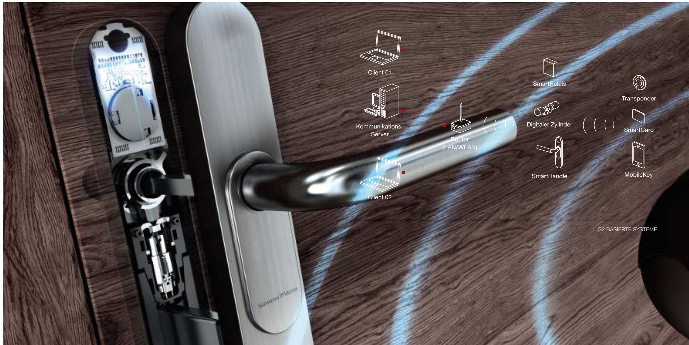
G2 BASIERTE SYSTEME

Elektronische Zutrittskontrollsysteme ersetzen die mechanischen Schlüssel und Schlösser durch ein einfach zu verwaltendes sicheres System, welches die genannten Risiken eliminiert. Schützen Sie unabhängig von der Größe Ihrer Unternehmung Mensch und Vermögenswerte vor Diebstahl und Vandalismus.